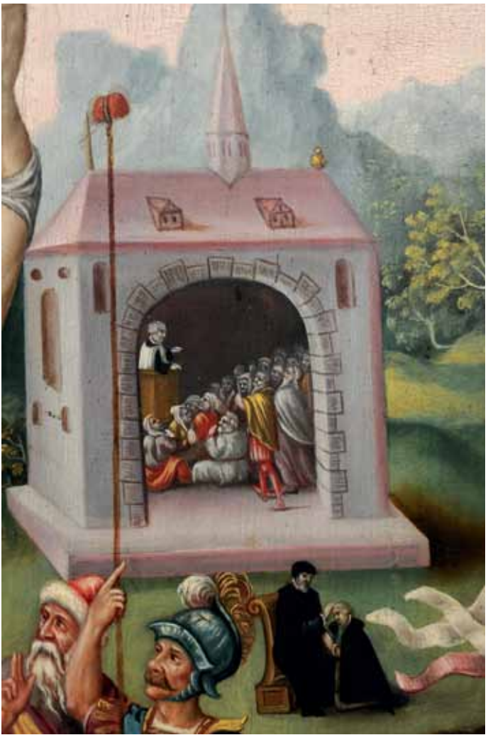
Kirche und Beichte Dogmenbild, Detail