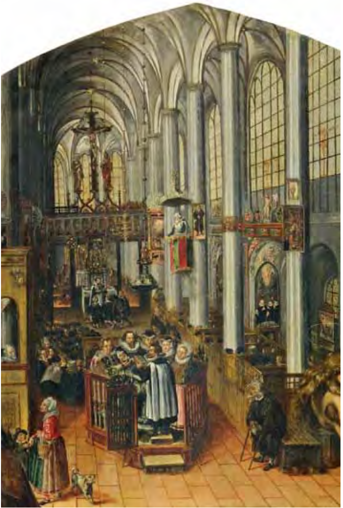
Innenansicht der Nikolaikirche um 1616