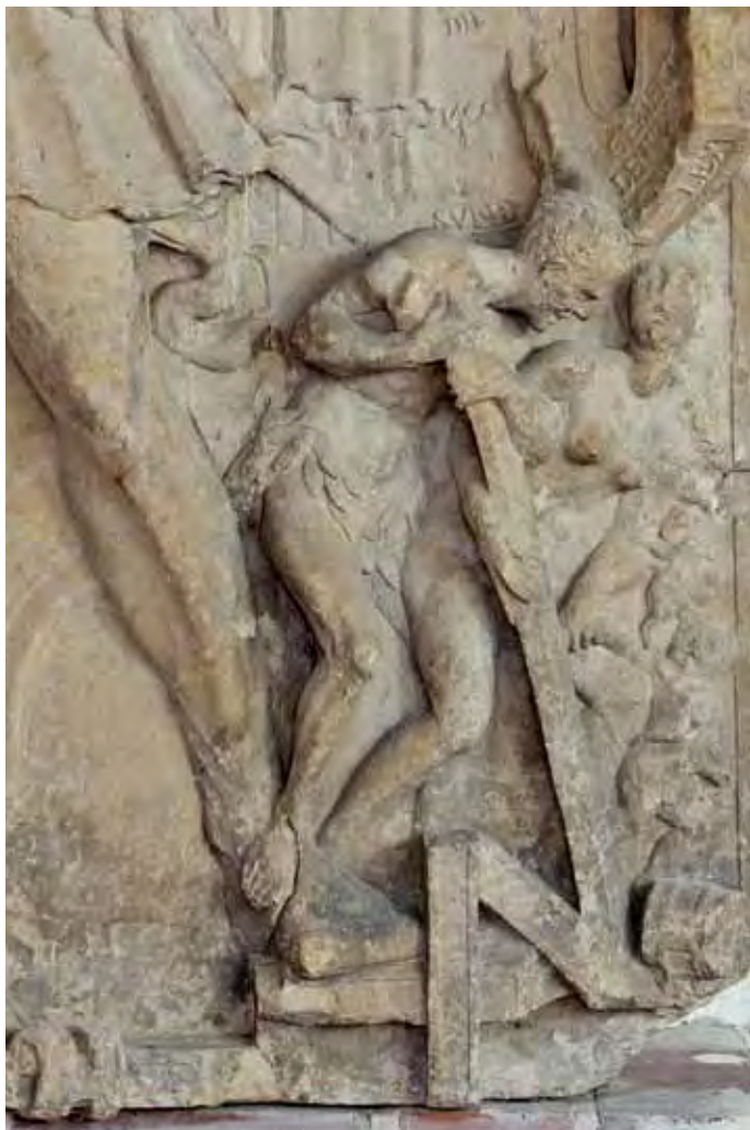
Allegorie auf die Rechtfertigungslehre Epitaph für Gregor Bagius, Detail