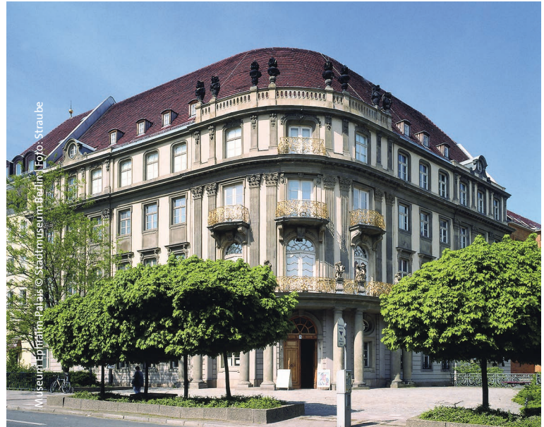
Museum Ephraim-Palais