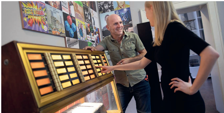
The sound of Berlin: der Klang der Stadt in 70 Songs von 1945 bis heute. | The sound of Berlin in 70 songs from 1945 until today.

The Märkisches Museum presents exhibitions on the history, art, culture and everyday life of Berlin. The location itself is unique: This stately brick structure with its imposing tower on the banks of the Spree was the first building in the world specifically dedicated to city history when it opened in 1908. The permanent exhibition "BerlinZEIT" features multimedia stations and original objects that give a compact, easy-to-understand picture of Berlin from the Ice Age to the present day.