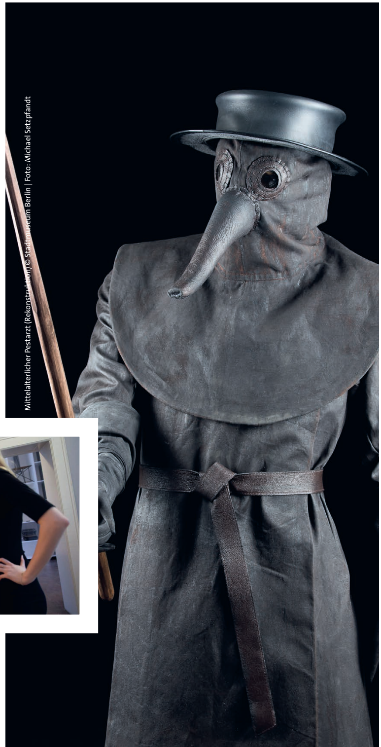
Mittelalterlicher Pestarzt (Rekonstruktion) © Stadtmuseum Berlin | Foto: Michael Setzpfandt

The Sound of Berlin © Stadtmuseum Berlin | Foto: Michael Setzpfandt