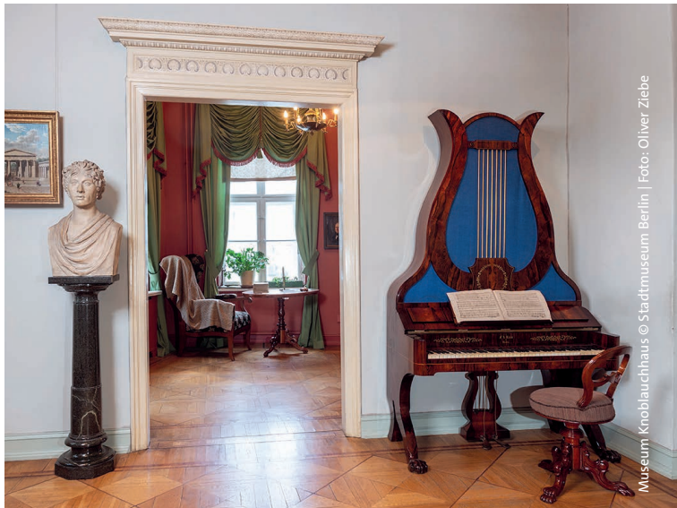
Museum Knoblauchhaus

The former home and business premises of the Knoblauch merchant family is one of Berlin's few preserved 18th-century townhouses. Carefully reconstructed spaces give a palpable sense of the attitudes and domestic life of the Biedermeier period. The family's prominent guests included the educational reformer Wilhelm von Humboldt and the architect Karl Friedrich Schinkel. The audio guide offers visitors an opportunity to get to know these figures as well as the Knoblauch family.