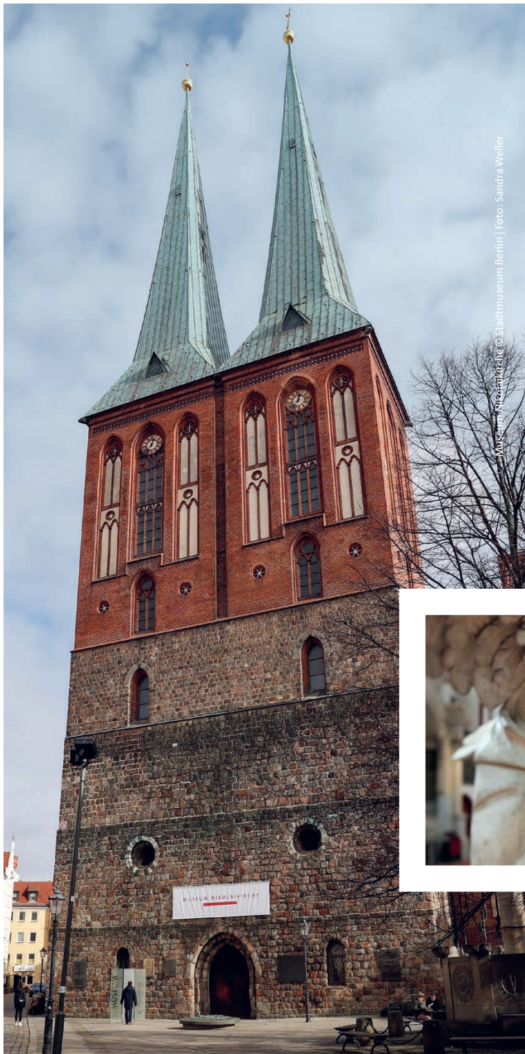
Museum Nikolaikirche